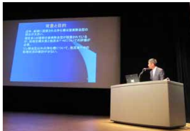
第28回全国浄化槽技術研究集会-研究発表

宮城県における7条検査結果から，試験的に放流水のT-N，T-Pを測定していた2008～2011年度のデータを用いて，戸建住宅に設置されている小型合併処理浄化槽のT-N，T-Pの処理状況を考察した。T-NはBOD除去型よりも窒素除去型が良好な傾向を示し，さらに窒素除去型をT-N10mg/L以下と20mg/L以下のグループで比較すると前者の方が良好な傾向が認められた。