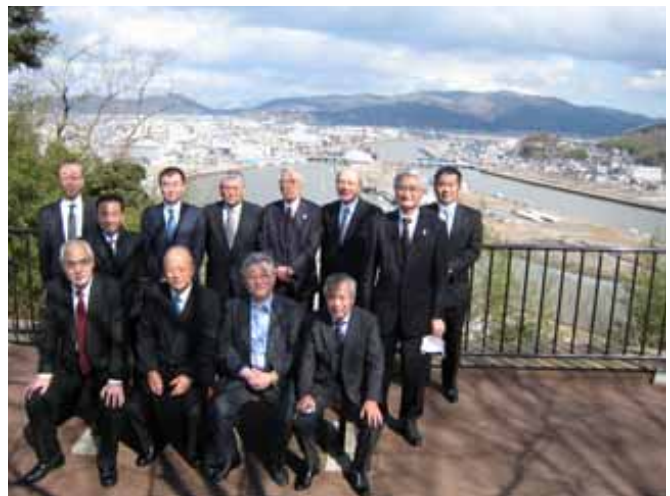
(一社)東京環境保全協会の被災地視察

東日本大震災を風化させないために、平成25年3月に発刊した東日本大震災の記録・体験記「絆」のCD-R版を作成し、製本版とともに関係団体等へ随時無償提供した。