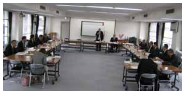
第1回合特法適用推進委員会