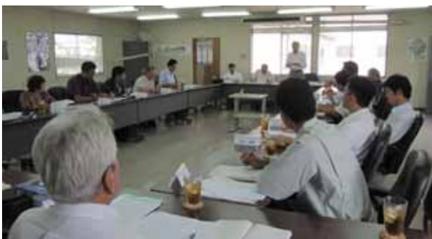
平成26年度第1回浄化槽部会