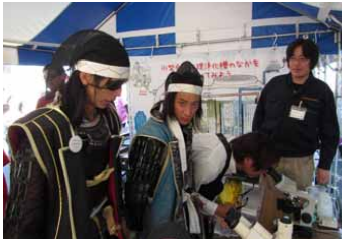
第26回宮城地区まつり