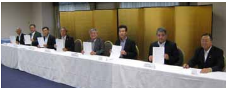
北海道・東北地区指定検査機関連絡協議会-協定締結式