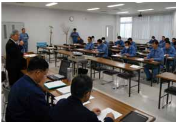
石巻地区連絡協議会維持管理技術研修会