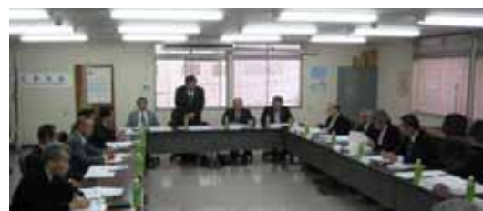
(公社)愛媛県浄化槽協会からの先進県役員研修

浄化槽法定検査の受検率向上を目的とした、法定検査方法等に関する情報提供及び浄化槽法定検査システム改修等による、平成28年度からの浄化槽法定検査システム運用開始に向けて取組んだ状況は、次のとおりである。