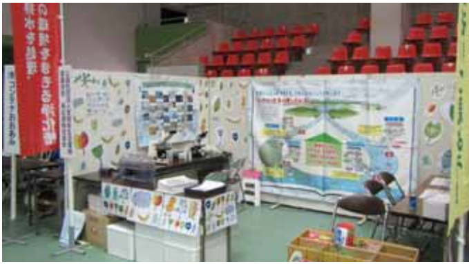
第10回登米市産業フェスティバル