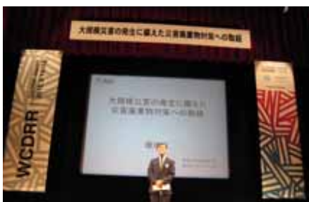
第3回国連防災世界会議