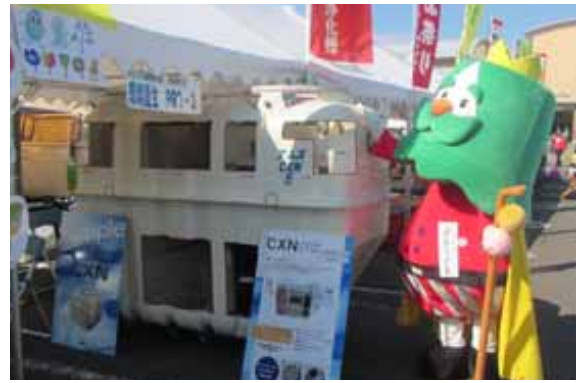
第11回蔵王町産業祭り