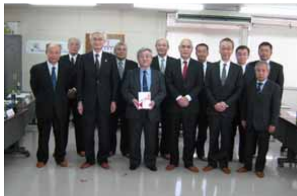
(一社)東京環境保全退職金共済会義援金伝達式