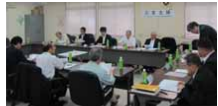
平成26年度第1回 浄化槽法定検査委員会