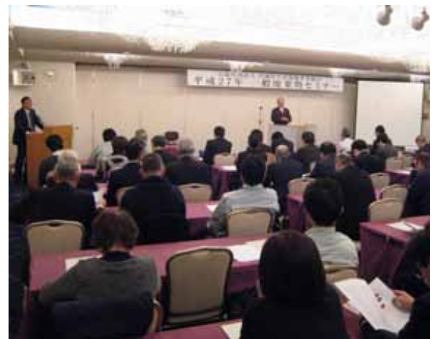
一般廃棄物セミナー