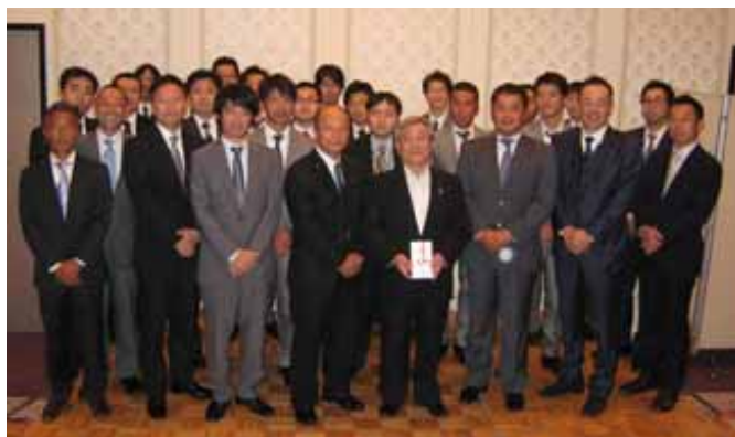
(一社)東京環境保全協会青年部義援金伝達式

これまでに寄せられた義援金は、被災地復興支援ボランティア活動等の支援に使用している。