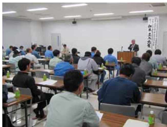
平成26年度浄化槽清掃技術研修会