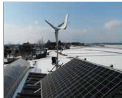
太陽光パネルと風力 発電装置の設置状況

平成25年度から実施している本研究では，浄化槽ブロワの電力を再生可能エネルギーでまかなう循環型浄化槽システムを実地に試験し，実用に耐える設備や運転条件について調査・研究するものである。これまでの結果から，日照不足時及び夜間の電力不足を解消するため，小型風力発電装置を追加し，太陽光発電とのハイブリット発電により，ブロワの電源供給を行っている。