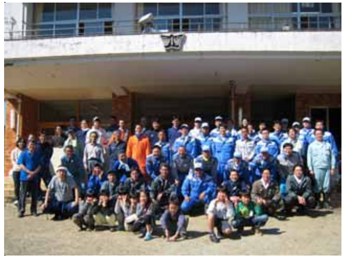
石巻市大原浜小学校での被災地復興支援ボランティア活動