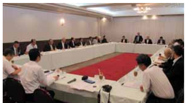
北海道・東北ブロック協議会:第20回総会