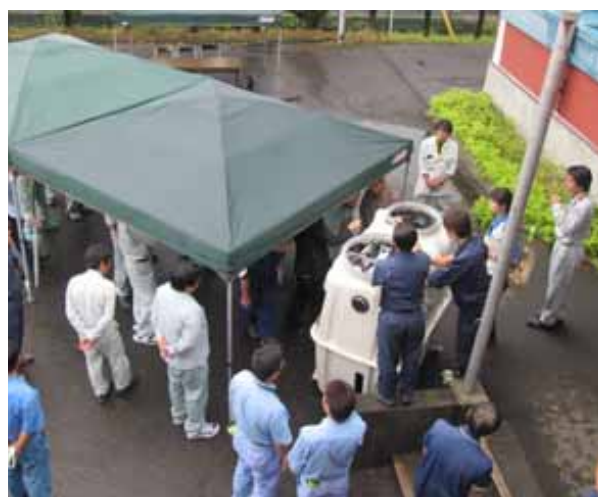
平成26年度第1回浄化槽維持管理技術研修会