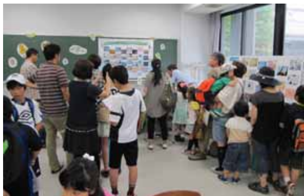
学都「仙台・宮城」サイエンス・フェスティバル2014