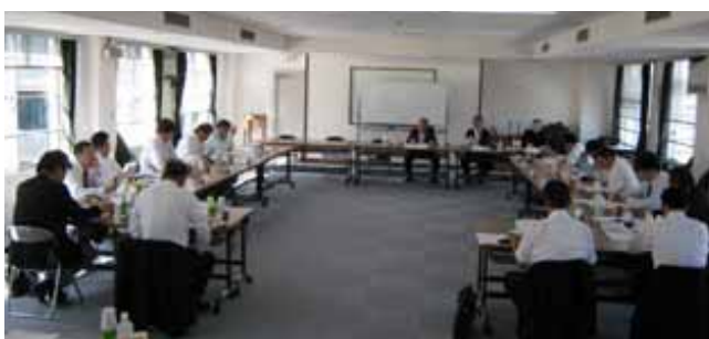
第1回浄化槽事業委員会