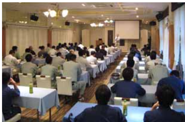
気仙沼・南三陸地区連絡協議会研修会