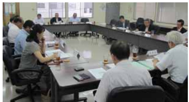
平成26年度第1回一般廃棄物部会