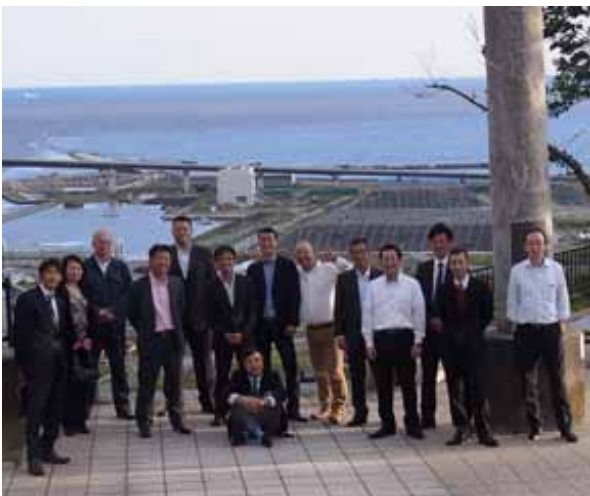
(一社)北海道環境保全協会の被災地視察