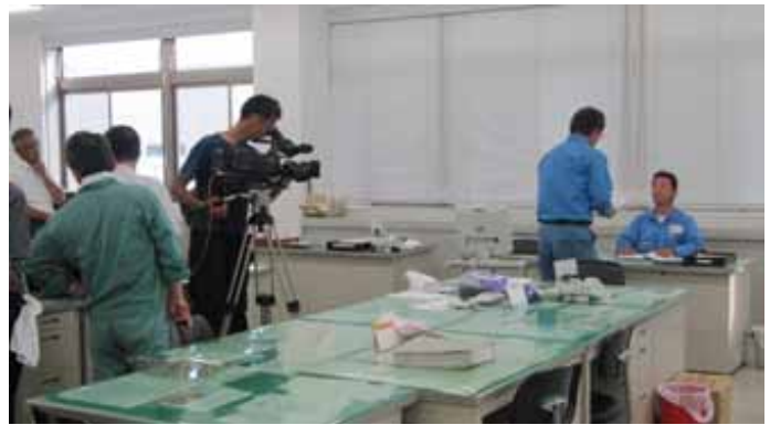
保守点検動画屋内撮影状況

5) 公1-5 浄化槽及び一般廃棄物の適正処理に関する研修会・セミナー等の開催 当協会で開催する浄化槽及び一般廃棄物の適正処理に関する研修会・セミナー等の開催状況は、次のとおりである。