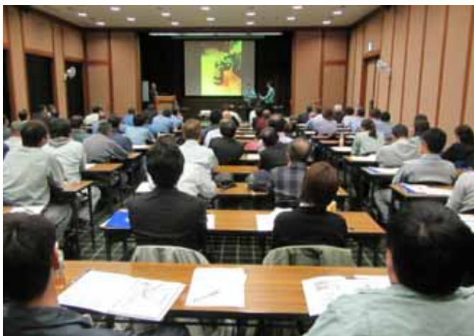
浄化槽の施工技術・適正管理に関する研修会