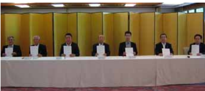
東北地区協議会: 大規模災害時における応援協力・支援活動に関する協定締結式