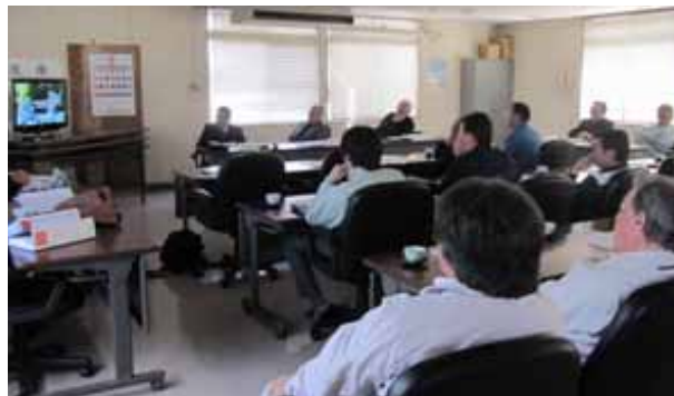
平成26年度第3回浄化槽部会・ 第13回浄化槽維持管理技術検討会