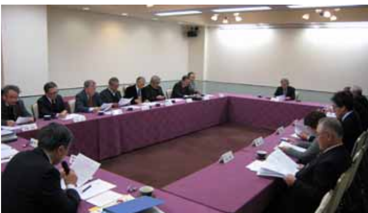
平成26年度臨時理事会