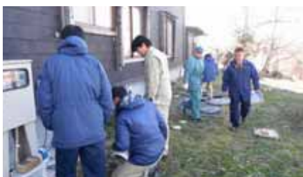
(公社)岩手県浄化槽協会との合同検査