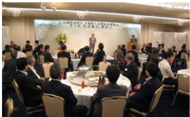
第6回社員総会懇親会