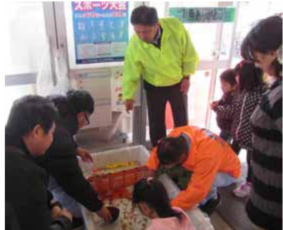
おおさき環境フェア2014