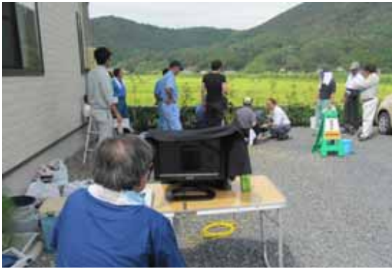
保守点検動画屋外撮影状況