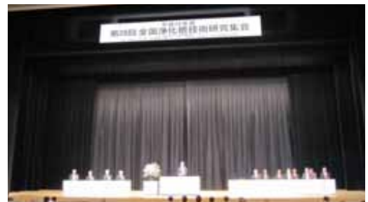
第28回全国浄化槽技術研究集会