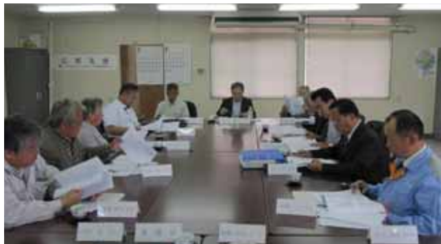
第9回浄化槽維持管理技術検討会