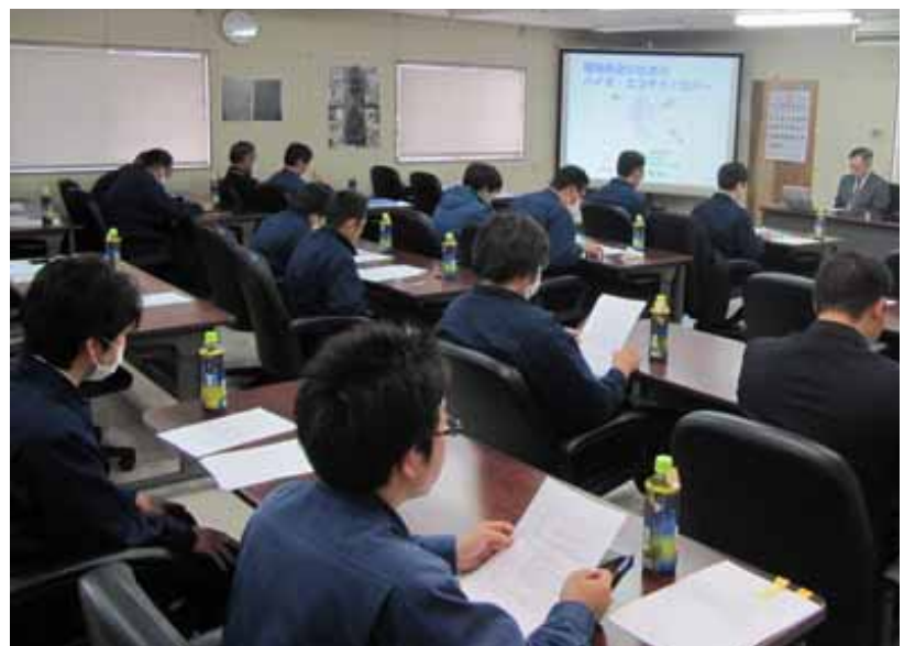
平成26年度検査員技術研修会