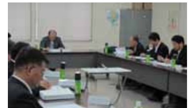
第10回浄化槽 水質検討委員会