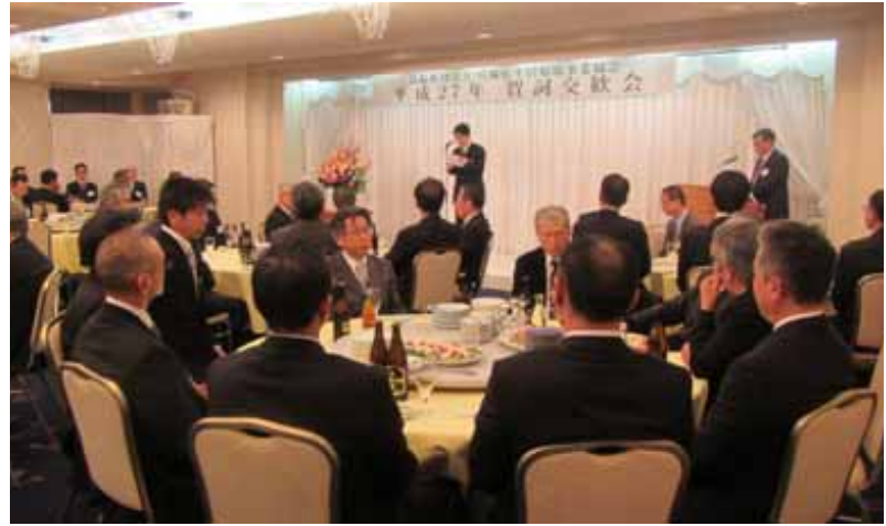
平成27年新春セナー及び賀詞交歓会

会員への情報提供として、会報第10号(平成26年7月1日)・第11号(平成27年1月1日)、(一社)全国浄化槽団体連合会発行の「全浄連NEWS」、(一社)日本環境保全協会発行の「環境保全タイムズ」等を郵送で随時配布した。