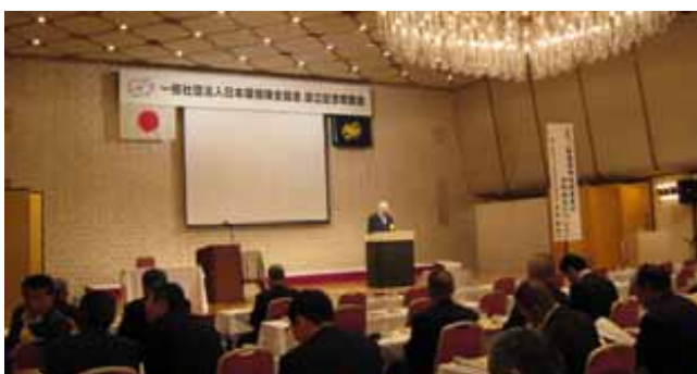
設立披露パーティー