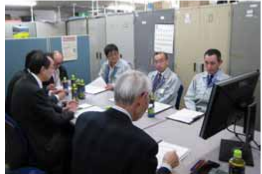
第8回共同研究事業の実施報告

新たな浄化槽管理システムの共同研究に関する協定を三者で締結し、一般社団法人全国浄化槽団体連合会の「スマート浄化槽」の開発及び当協会の浄化槽法定検査システム改修に向けて、法定検査のデータと仙台市の浄化槽業務の一部管理情報を利用し、浄化槽のICT利用による業務改善を目的として共同研究を行った取組み状況は、次のとおりである。