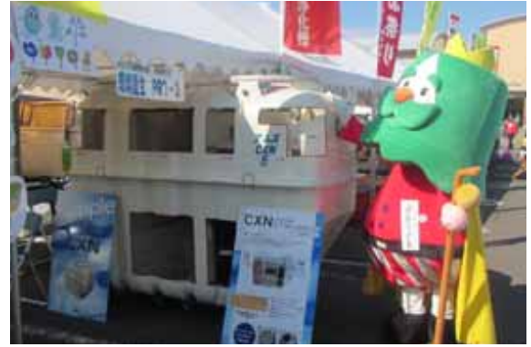
第11回蔵王町産業祭り