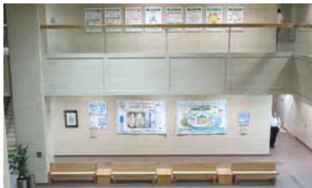
宮城県庁へ浄化槽に関するパネル・タポリー展示