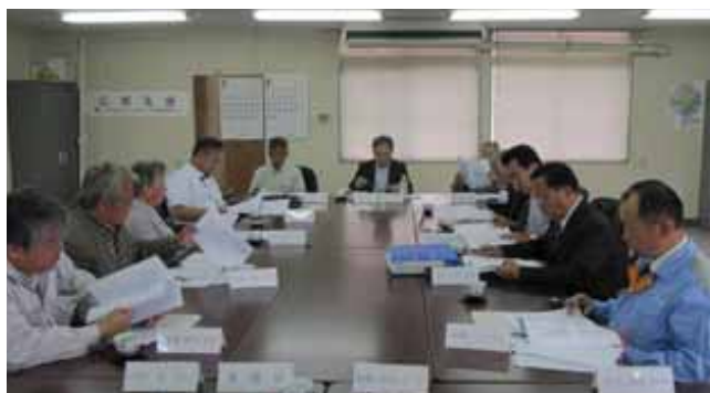
第9回浄化槽維持管理技術検討会