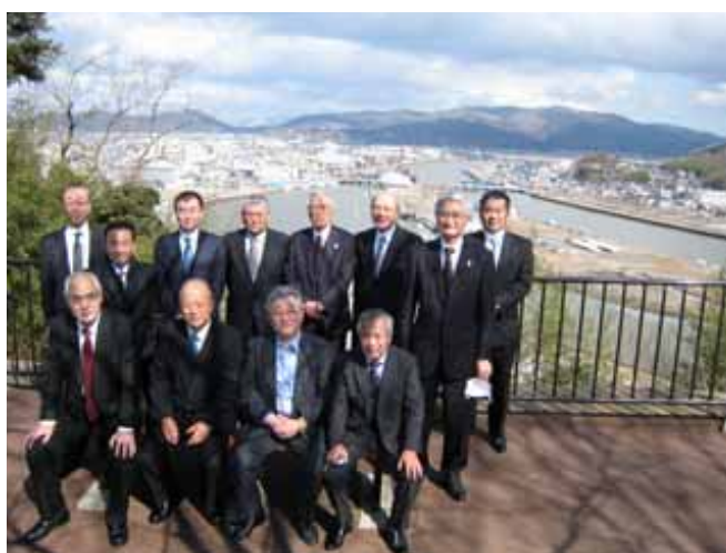
(一社)東京環境保全協会の被災地視察

東日本大震災を風化させないために、平成25年3月に発刊した東日本大震災の記録・体験記「絆」のCD-R版を作成し、製本版とともに関係団体等へ随時無償提供した。