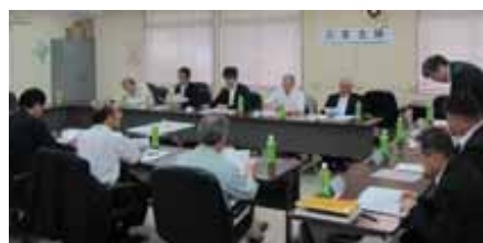
平成26年度第1回 浄化槽法定検査委員会