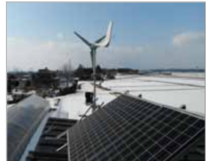
太陽光パネルと風力 発電装置の設置状況

平成25年度から実施している本研究では，浄化槽ブロワの電力を再生可能エネルギーでまかなう循環型浄化槽システムを実地に試験し，実用に耐える設備や運転条件について調査・研究するものである。これまでの結果から，日照不足時及び夜間の電力不足を解消するため，小型風力発電装置を追加し，太陽光発電とのハイブリット発電により，ブロワの電源供給を行っている。