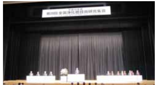
第28回全国浄化槽技術研究集会