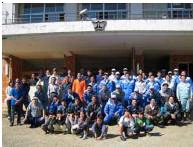
石巻市大原浜小学校での被災地復興支援ボランティア活動