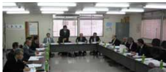
(公社)愛媛県浄化槽協会からの先進県役員研修

浄化槽法定検査の受検率向上を目的とした、法定検査方法等に関する情報提供及び浄化槽法定検査システム改修等による、平成28年度からの浄化槽法定検査システム運用開始に向けて取組んだ状況は、次のとおりである。