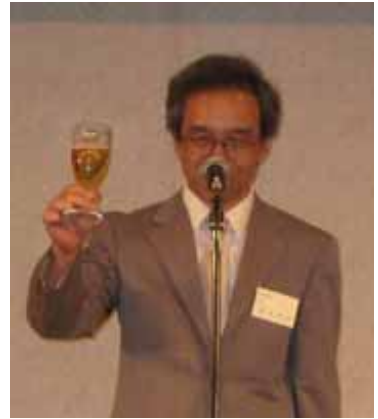
第2回社員総会及び懇親会