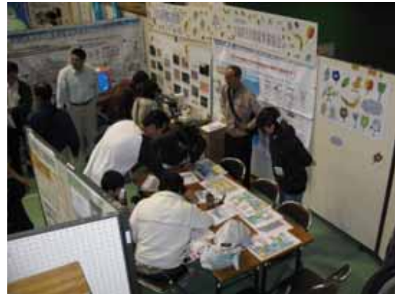
登米市産業フェスティバル