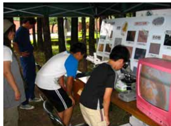
2010水のワークショップ