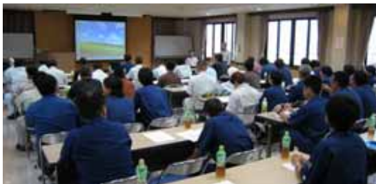
気仙沼・南三陸地区連絡協議会勉強会