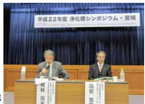
浄化槽シンポジウム・宮城