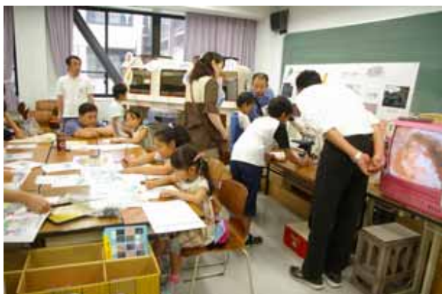
学都「仙台・宮城」サイエンスフェスティバル2010