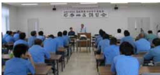
石巻地区連絡協議会講習会