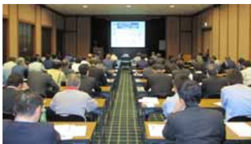
浄化槽の施工技術・適正管理に関する研修会