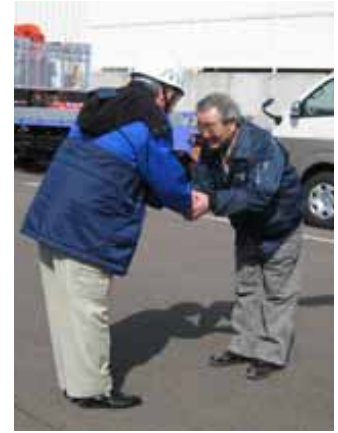
鹿児島県環境整備事業協同組合からの支援車両