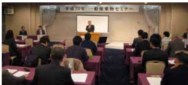
一般廃棄物セミナー