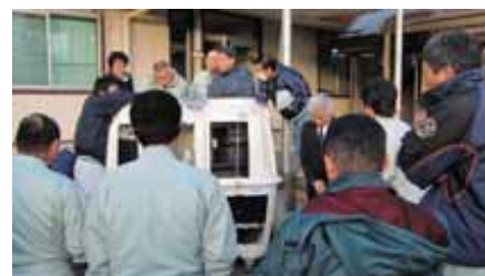
第2回浄化槽維持管理技術研修会