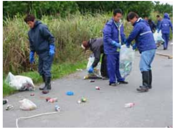
平成22年度ごみゼロ清掃奉仕活動