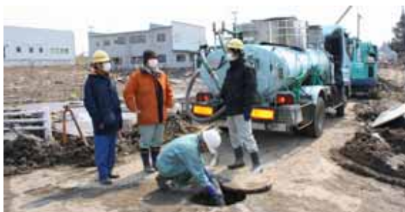
(社)山形県水質保全協会からの復旧支援