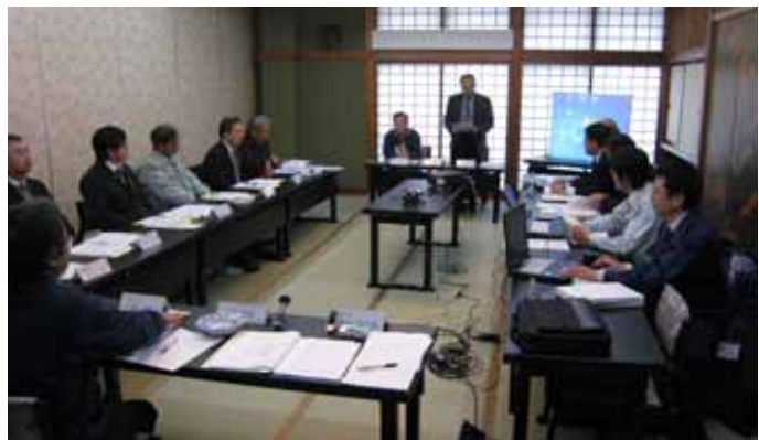
第1回浄化槽維持管理技術検討会