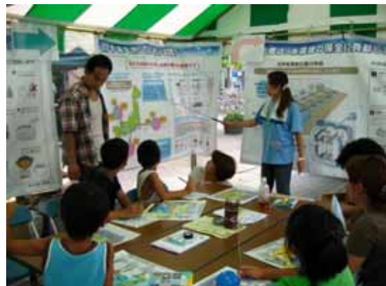
2010仙台市下水道フェア