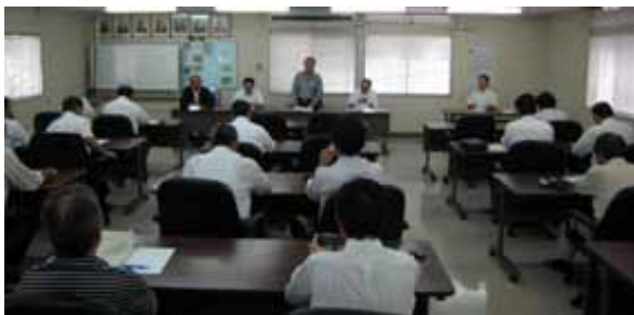
第1回一般廃棄物部会及び第1回浄化槽部会合同会議