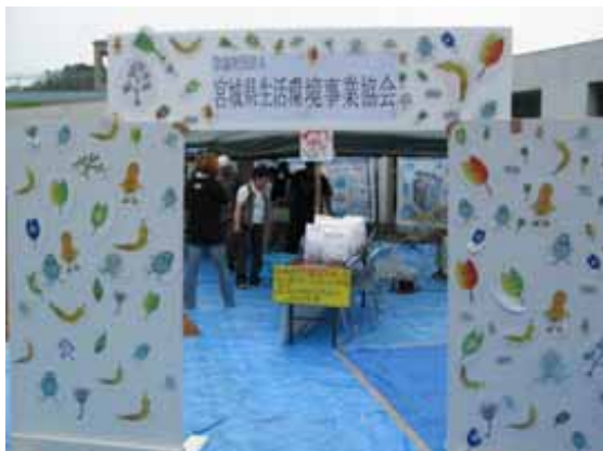
みんなでつくるエコシティ気仙沼