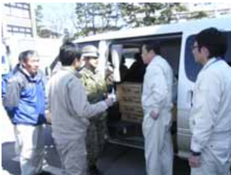
環清工業(株)からの支援物資