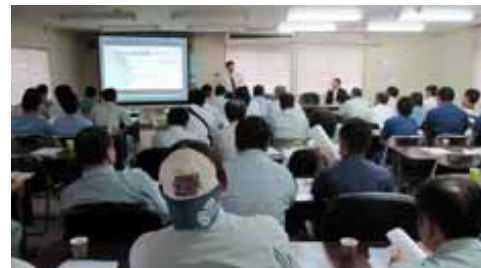
第1回浄化槽維持管理技術研修会