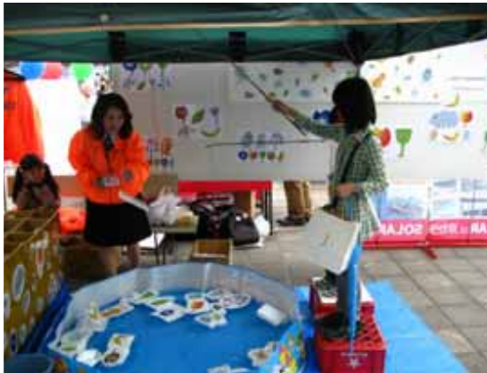
大崎市環境フェア