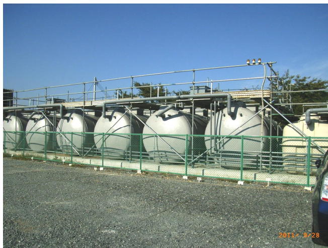
写真 気仙沼市五右衛門ヶ原運動場仮設住宅の浄化槽

震災から一年半が経ち、いまはすべての仮設住宅浄化槽で保守点検、清掃、法定検査が実現しています。けれどもまだ、これから取り組むべき課題も残っています。