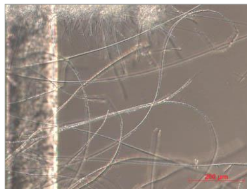
写真-3 Beggiatoa 属(×100)

性種に裸口類の Litonotus 属、低DO時に出現する細菌類の Beggiatoa 属 1),2),5) (写真-3)およびラセン菌などが出現していた。このときの処理水BODは10mg/Lと良好であった。しかし、124日目に処理水BODが22mg/Lとなり、 Rotaria 属が優占種となっているが、伴生種に毛口類の Paramecium 属や線虫類の Diplogaster 属(Nematoda)が出現していたことから、生物膜の肥厚化が考えられた。生物膜量の測定結果を見ると8.2 mg/cm 2 から14.3 mg/cm 2 に増加していた。処理水質は性能基準値を下回っていたが、