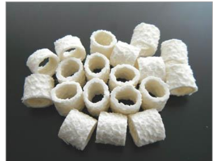
写真-1 流動担体の外観

担体流動槽上部の担体押さえ面の一部に10×10cmの採取口を設け、水位を低下させた状態で採取口から流動担体を無作為に10個採取した。その担体からブラシにより生物膜を剥離させ、生物膜量としてSSの測定を行った。主に生物膜は内部に付着しており、光学顕微鏡を用いて付着微生物の生物相を観察し同定した。使用担体の外観を写真-1に示したが、担体の種類等は、形状は中空円筒状となっており、比重は約1.0、外径は約12mm×長さ約11mm、素材はポリプロピレン製である。