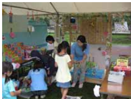
仙台市下水道フェア