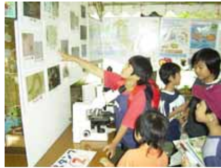
柴田町環境フェア