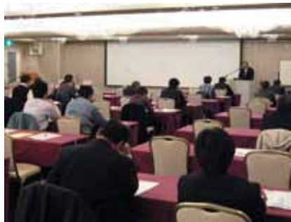
一 般 廃 棄 物 セ ミ ナ ー