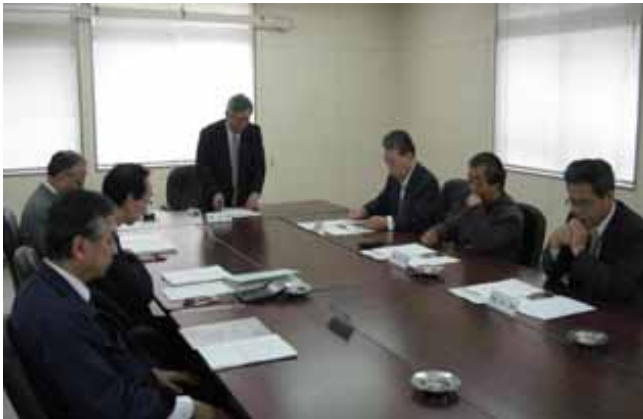
第 1 回 監 事 会