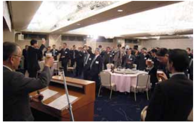
平成21年賀詞交歓会