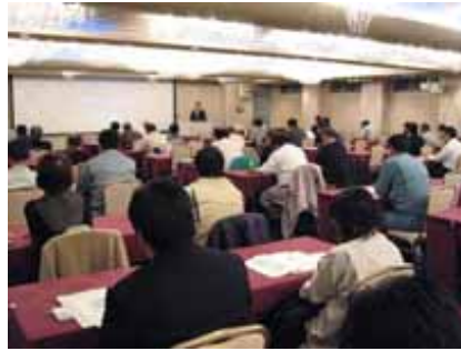
浄化槽の施工技術・適正管理に関する研修会