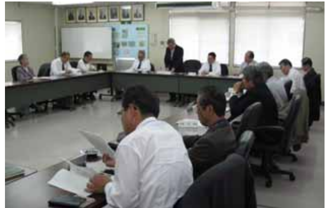
第1回理事会及び第2回監事会合同会議