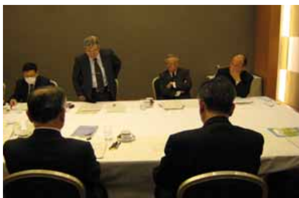
第 5 回 三 役 会 議