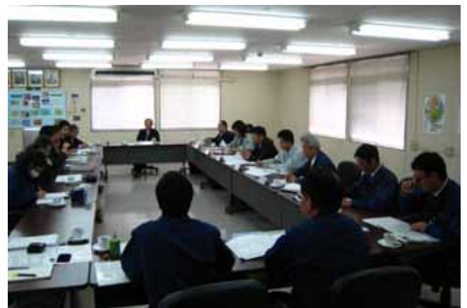
第5回 浄化槽水質検討委員会