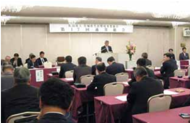
第 17 回 通 常 総 会