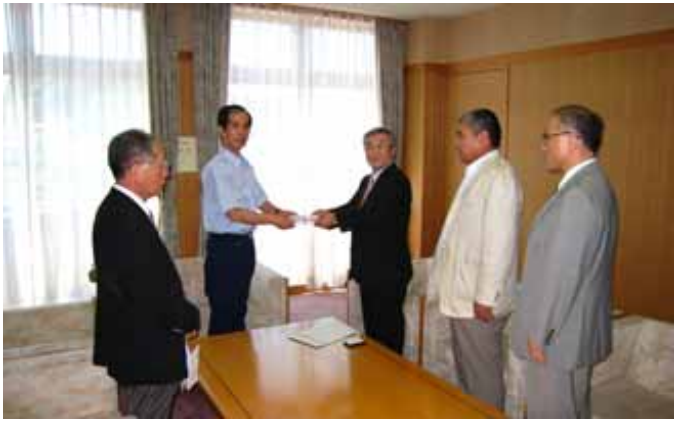
栗原市へ義援金持参