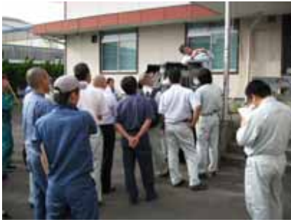
浄化槽維持管理研修会