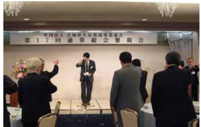
第 17 回 通 常 総 会 懇 親 会