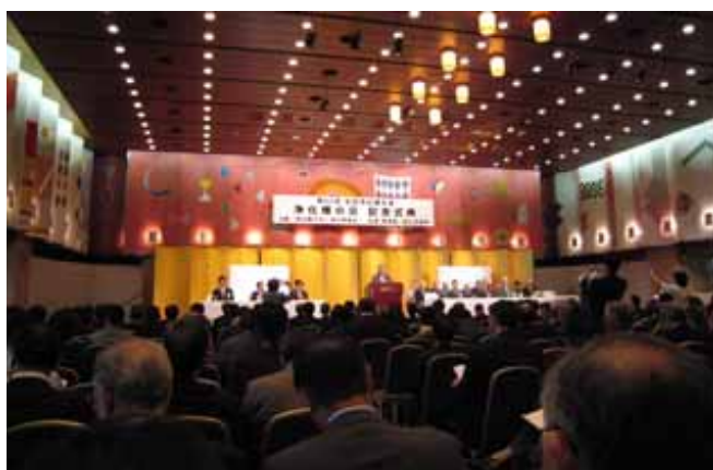
第 22 回 全国浄化槽大会