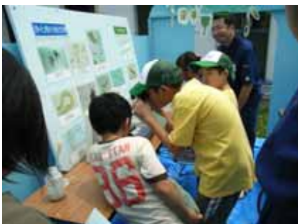
エコフェスタ気仙沼

日環保タイムズ及び全浄連ニュースは随時配布した。また、ホームページは最新情報を随時更新した。