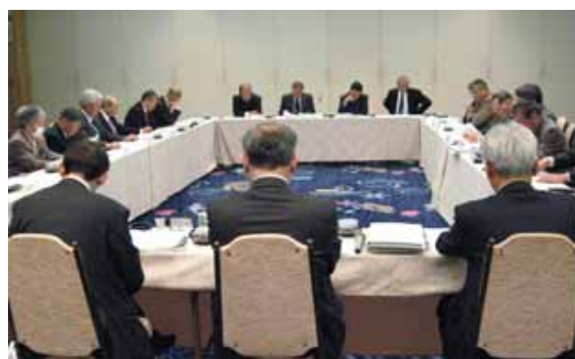
第3回理事会及び第3回監事会合同会議