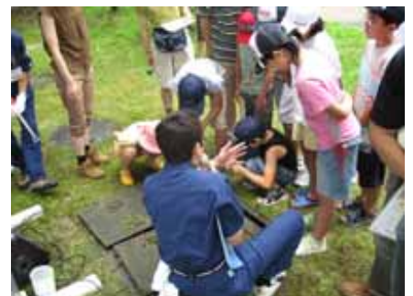
水のワークショップ